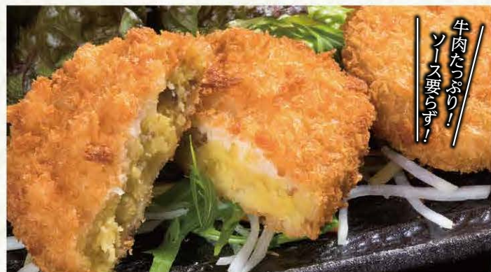
そのまんまコロッケ (2個) ... 397円