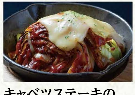
キャベツステーキの ガーリックトマトソース