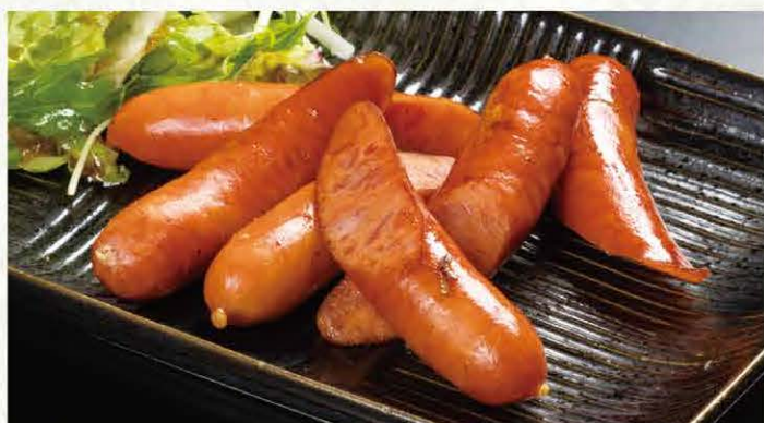
激辛ソーセージ 530円