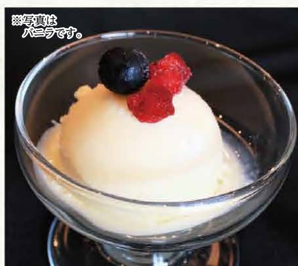
アイス クリーム (バニラorゆず) 252円