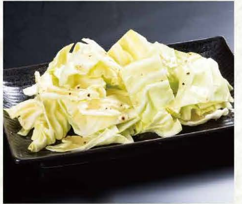
旨だれ生キャベツ (塩だれorごまだれ) 234円