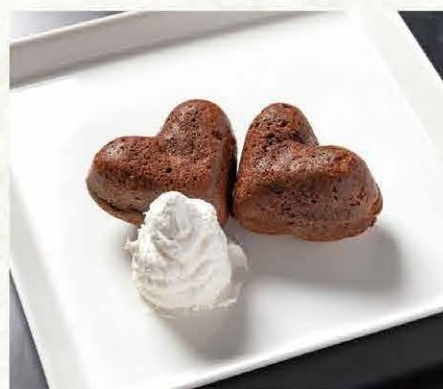
自家製 ブラウニー 368円