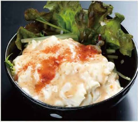
特製ポテトサラダ ※パプリカパウダーを 使用しています。 437円