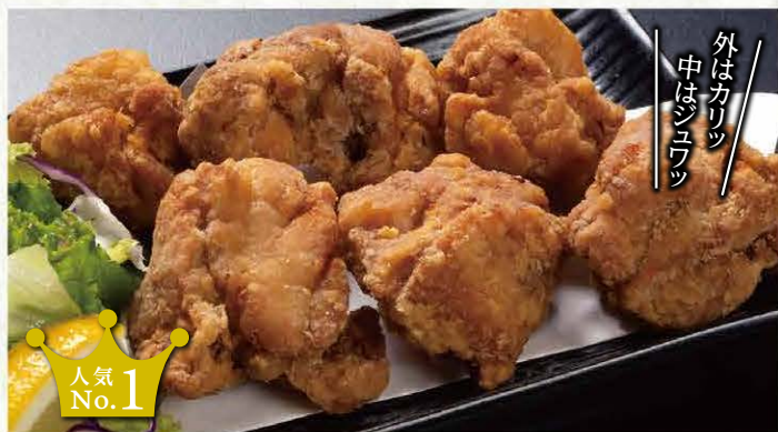
バリ旨唐揚げ (6個) ..... 510円