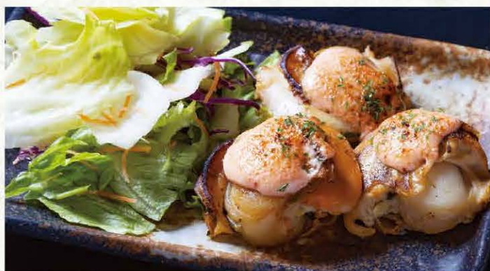
ホタテの明太マヨ 1,080円