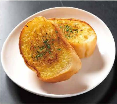
ガーリックフランス (2個) 183円