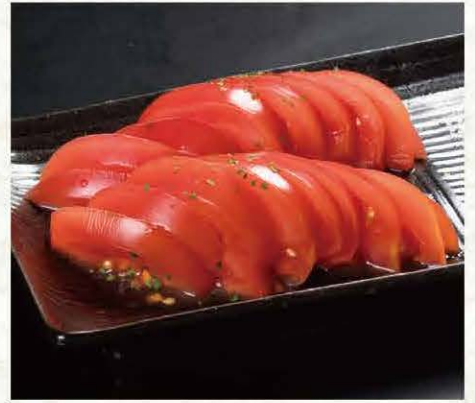
冷やしトマト スライス 327円