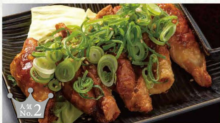
鶏皮餃子 (5個) ..... 714円