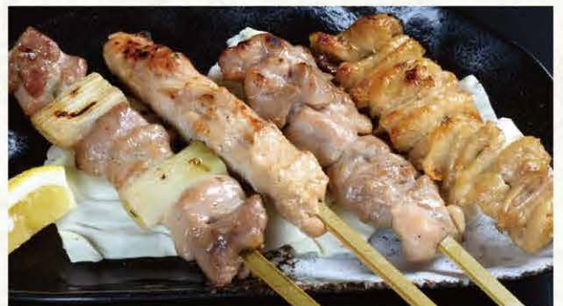
串焼き四種 盛り合わせ (タレor塩) 580円