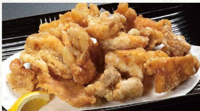
とり皮せんべい ..... 483円