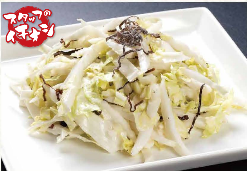
白菜と塩こんぶの シーザーサラダ 490円