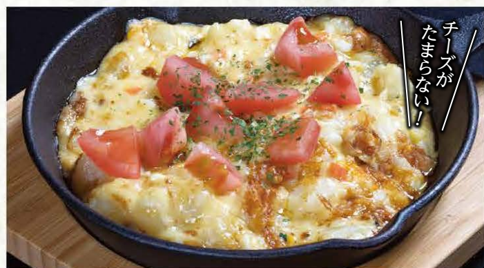
焼きチーズポテトサラダ 600円