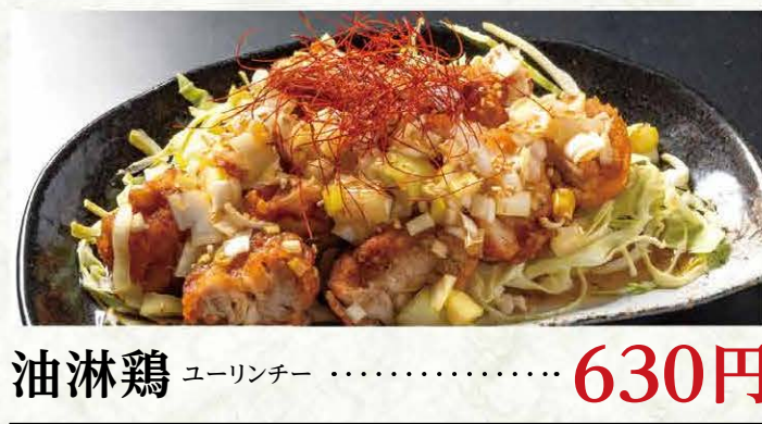
油淋鶏 ユーリンチー ..... 630円