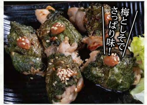
とりももの 梅しそ巻き