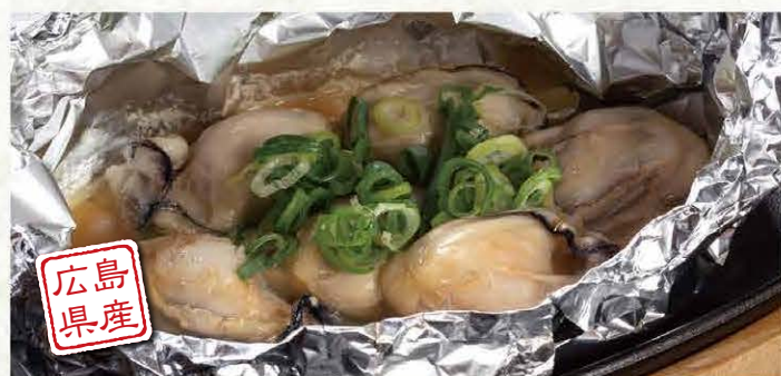
かきホイル焼き (ポン酢orバター醤油) 999円