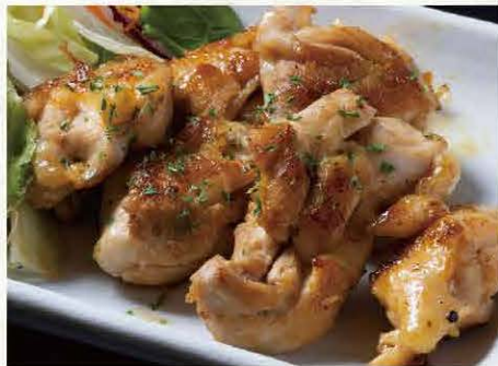
とりももガーリック バター焼き