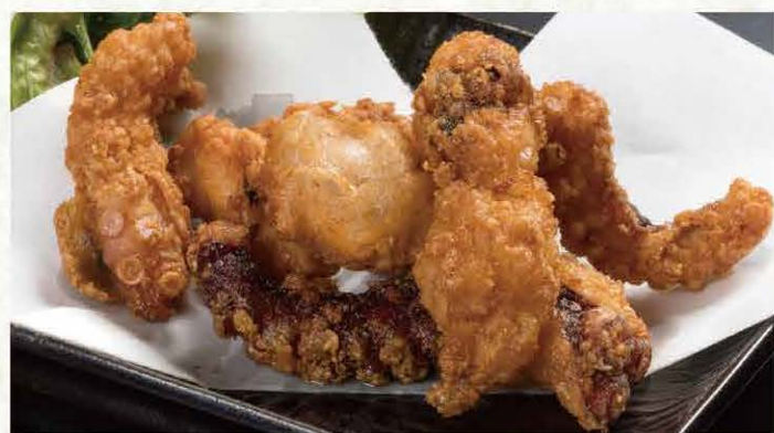
タコの唐揚げ ..... 589円