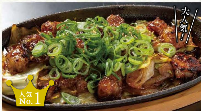
ぷりぷりホルモン焼き 927円